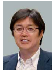
荒木浩 (あらき・ひろし)

1971-72年、別府市に交換学生として滞在する。1983年京都大学修士(国語学国文学専修)1989年ハーバード大学博士(東アジア研究、特に日本近世文学研究)。1989年~2020年、米国・日本・ニュージーランドの大学で日本文学の講義・論文指導に関わる。Takebe Ayatari: A Bunjin Bohemian in Early Modern Japan (2004)などの著書や共編、研究論文、書評、学会発表など多数。2017年、外務大臣表彰授与(日本とニュージーランドの文化・学術交流に貢献)。2020年から京都市在住。